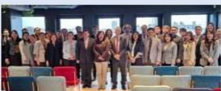
18-22 ก.ย. 66 (กรุงบรัสเซลส์) การเจรจา FTA ไทย-EU รอบที่ 1