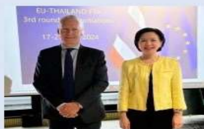
17-21 มิ.ย. 67 (กรุงบรัสเซลส์) การเจรจา FTA ไทย-EU รอบที่ 3