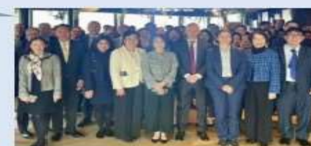
31 มี.ค.-4 เม.ย. 68 (กรุงบรัสเซลส์) การเจรจา FTA ไทย-EU รอบที่ 5