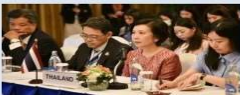
22-26 ม.ค. 67 (กรุงเทพฯ) การเจรจา FTA ไทย-EU รอบที่ 2